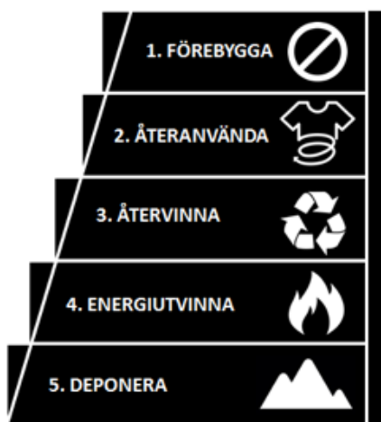
Figur 1. Avfallshierarkin, modellen som styr svensk och europeisk avfallshantering. Illustration: Nils Johansson

Vidare läsning: Europaparlamentet och Europeiska Unionens Råd (2008/98/EC); Naturvårdsverket (2015); Hultman och Corvellec (2012); Zapata Campos, Eriksson-Zetterquist och Zapata (2014)